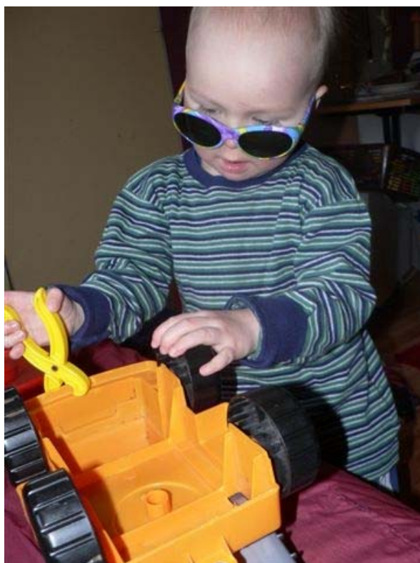
"Autolla ajetaan varo-varovasti" ...