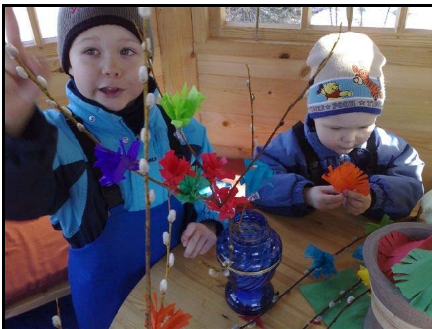
"Kevät keikkuen tulevi".