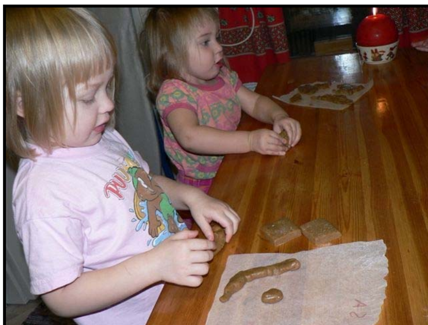
Tytöt tekevät piparimatoa.